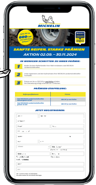
Abbildung und Inhalte ähnlich