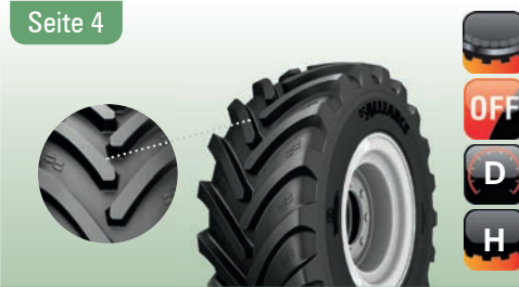
372 Agriflex R-1W