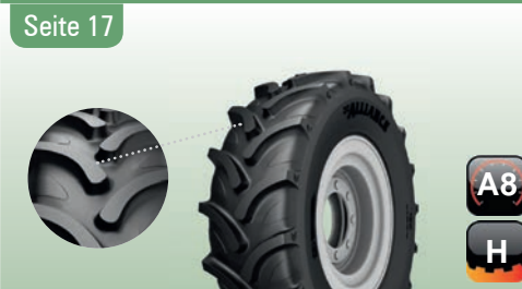
845/ FarmPRO 70 R-1W