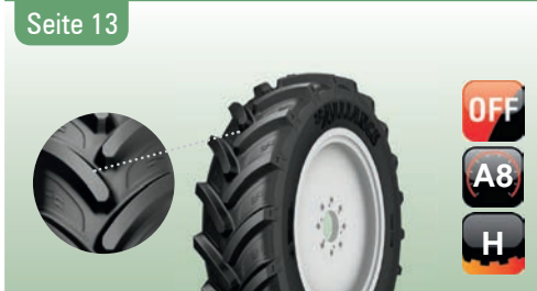
370 Agristar R-1W