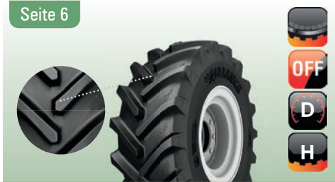
378 AGRISTAR XL R-1W