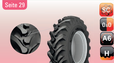
Trac PRO 348 R-1