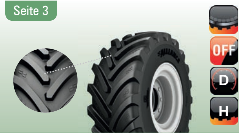
372 Agriflex+ R-1W