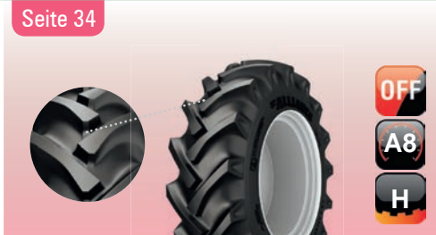
324 FarmPRO R-1