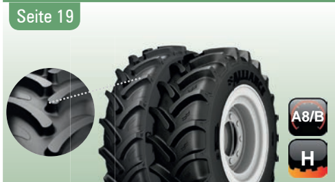
FarmPRO 842 und FarmPRO II 846 R-1W